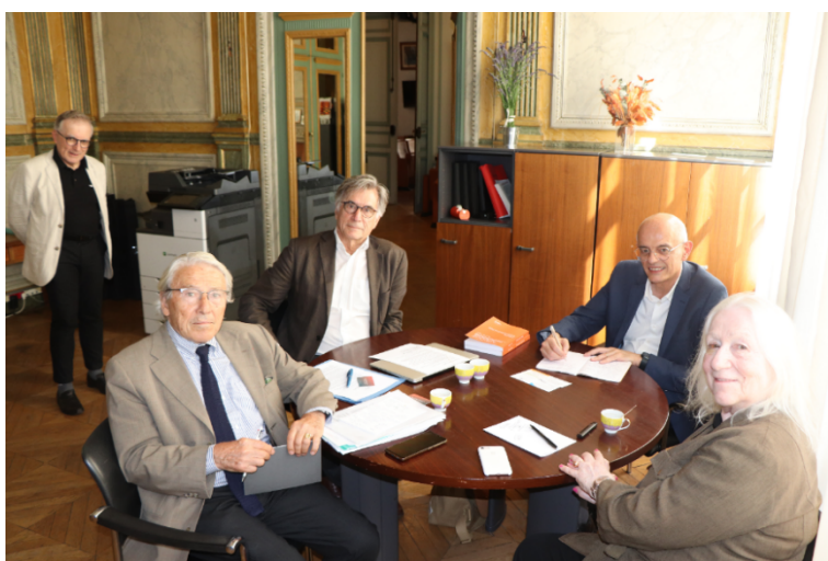
26 juin : Visite d' Agnès Canayer , ancienne sénatrice et, depuis le 21 septembre 2024, Ministre déléguée auprès du ministre des Solidarités, de l'Autonomie et de l'Égalité entre les femmes et les hommes, chargée de la Famille et de la Petite Enfance.